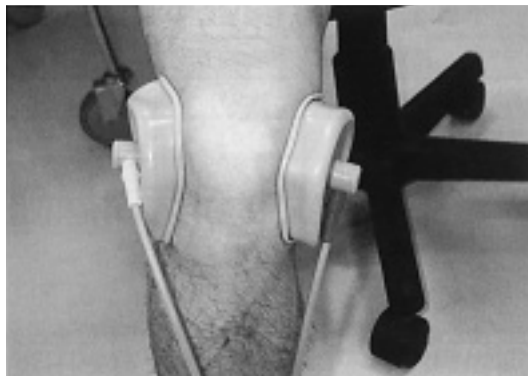
図3 治療導子と導子装着部位

評価方法は，治療の直前と直後に SF-MPQ を測定し，①各表現項目選択延べ人数，②各表現項目変化率の平均，③表現項目平均選択数を算出して検討した。統計処理は，SF-MPQ 内での疼痛の性状と VAS の比較検討について Mann-Whitney U テストを用い，危険率 5%未満を有意な差とした。